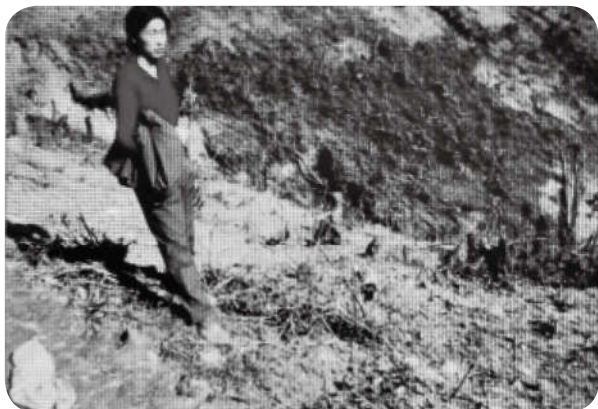
工事外被炸成一片焦土，这里本是原始森林。

自豪地写到，我“完成了一些我梦寐以求的天职”，“这使我感到极大的高兴和自豪”。6月中旬，在海荣获“三等功”。上阵地7个月后，他累计“在前沿单独抢救伤员已达100多名”，其中有30余名牺牲者，12月下旬，上级把他的三等功晋升为二等功。