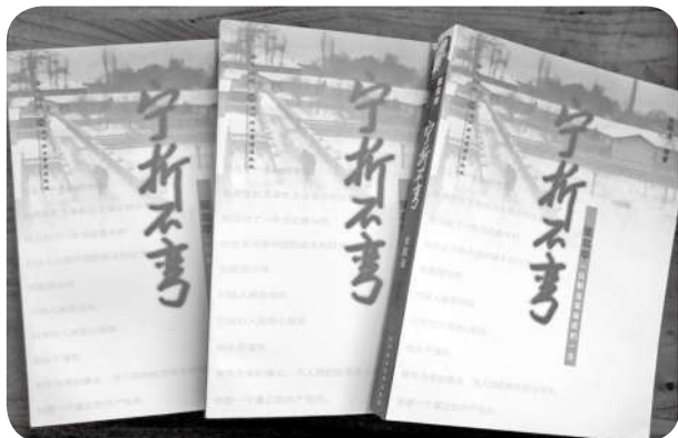
深圳报业集团出版社 于2009年4月出版的《宁折不弯》

今年，是泰西抗日武装起义爆发82周年，也是起义主要领导者张北华同志逝世45周年。此时此刻，重读张北华纪念文集《宁折不弯》，那一幕幕波澜壮阔的历史画面在脑屏重现。张北华在惊涛骇浪中英勇搏击，在逶迤崎岖山道上矻矻攀登，为民族解放、新中国建立及发展做出了积极贡献，令人肃然起敬。然而，在恶劣环境里刚正不阿、宁折不弯的勇士张北华，更让人肃然起敬，心中浪涛汹涌、久久难以平静。