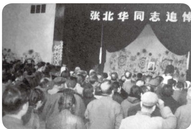
1975年12月4日，张北华追悼会在兰州举行。

经不懈努力，三个多月后，终于得到消息，“你们的信邓小平批回来了。”喜悦之情，难以言表。在许多老同志的支持和帮助下，有了邓小平同志的批示，甘肃省委终于重新给张北华作了结论，恢复其党籍。